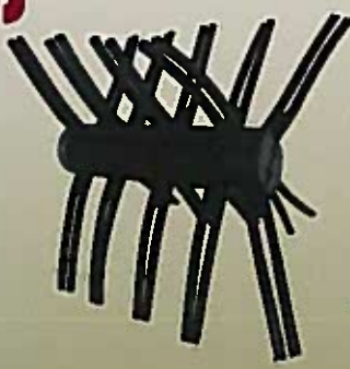
RULLO CON FLAGELLI SPECIALI IN GOMMA, CON SISTEMA DI AGGANCIO / SGANCIO "PUSH&PULL"