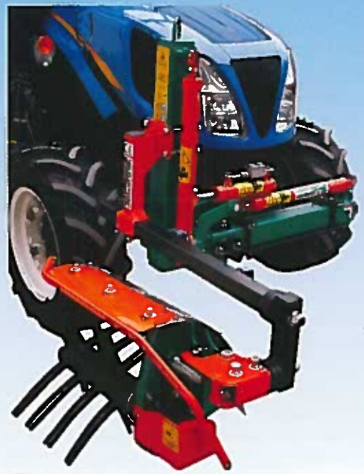
SPOLLONATRICE IDRAULICA MOD. "ROTOFLEX"

In fact, one of the shafts, equipped with heavy whips in special rubber with a flat shape and rounded double points at the ends and with rapid "push&pull" connection system, will allow optimizing the spring operation on new grass yet at the presence of a big quantity of shoots, while the second small aluminum roller bearing nylon whips will allow the best management of thicker and stronger weed during the whole vegetative season. The aim of this innovation is to work in vineyards at the presence of grown weeds and diffused shoots, over the whole seasonal vegetative stage of the vine, without damaging or causing shocks to the plant: this can be obtained also thanks to an "oil-control" system permitting to regulate the rotation speed of the equipment depending on the type of whipping shaft used and the conditions of the weeds at the moment of the operation.