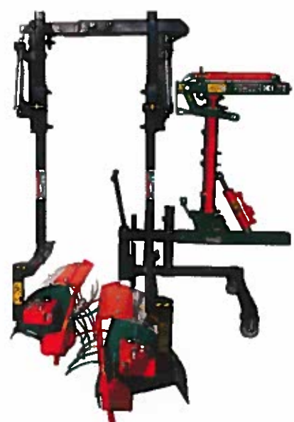
SPOLLONATRICE MOD. "ROTOFLEX" IN VERSIONE TUNNEL, SU TELAIO CIMATRICE CON SUPPORTO SCAVALLANTE E FLAGELLI TONDI IN NYLON.